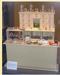
Kinderkaufladen von 1946

Die Ausstellung „Supermarkt der Jahrhundertwende“ informiert über die Geschichte eines Friedberger Kolonial-