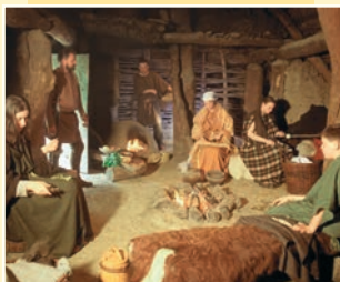
Nachgestellte Alltagsszene einer keltischen Familie

Die archäologische Abteilung zeigt einen Überblick über heimische Kulturen von der Steinzeit bis ins frühe Mittelalter. Dabei wird deutlich, dass die geographisch günstig gelegene und äußerst fruchtbare Landschaft der Wetterau durch die Zeiten eine kulturgeschichtlich bedeutende Rolle spielt.