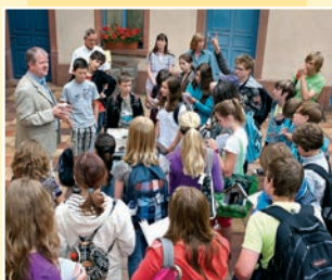
Projekt „Friedberg macht Schule“ 2011 im Hof des Wetterau-Museums

Nicht nur für Schulklassen bietet das Wetterau-Museum mit seinen Sammlungen und Ausstellungen zahlreiche Anknüpfungsmöglichkeiten für den Heimat- oder Sachkundeunterricht in der Grundstufe oder die Fächer Geschichte, Politik & Wirtschaft oder Kunst in der Sekundarstufe 1 und 2. Die Beschäftigung mit der Geschichte und Kultur der eigenen Stadt und Region bildet eine entscheidende Grundlage. Allgemeine geschichtliche Themen können am heimischen Beispiel konkret und nah an der eigenen Lebenswelt vermittelt werden. Durch nichts zu ersetzen ist beim Museumsbesuch der unmittelbare Kontakt mit originalen materiellen Zeugnissen unserer Geschichte und Kultur. Die Möglichkeiten der Vermittlung sind vielfältig und altersgerecht: neben der klassischen Führung reicht das Spektrum von der spielerischen Erkundung über Workshops, Fragebögen und Aufgaben bis zur Projektarbeit. Themen und Herangehensweise können im Vorfeld mit den Museumsmitarbeitern individuell abgestimmt werden.