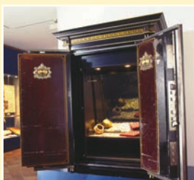
Römischer Münzschatz in Gründerzeit-Tresor

Nicht nur für Schulklassen bietet das Wetterau-Museum mit seinen Sammlungen und Ausstellungen zahlreiche Anknüpfungsmöglichkeiten für den Heimat- oder Sachkundeunterricht in der Grundstufe oder die Fächer Geschichte, Politik & Wirtschaft oder Kunst in der Sekundarstufe 1 und 2. Die Beschäftigung mit der Geschichte und Kultur der eigenen Stadt und Region bildet eine entscheidende Grundlage. Allgemeine geschichtliche Themen können am heimischen Beispiel konkret und nah an der eigenen Lebenswelt vermittelt werden. Durch nichts zu ersetzen ist beim Museumsbesuch der unmittelbare Kontakt mit originalen materiellen Zeugnissen unserer Geschichte und Kultur. Die Möglichkeiten der Vermittlung sind vielfältig und altersgerecht: neben der klassischen Führung reicht das Spektrum von der spielerischen Erkundung über Workshops, Fragebögen und Aufgaben bis zur Projektarbeit. Themen und Herangehensweise können im Vorfeld mit den Museumsmitarbeitern individuell abgestimmt werden.