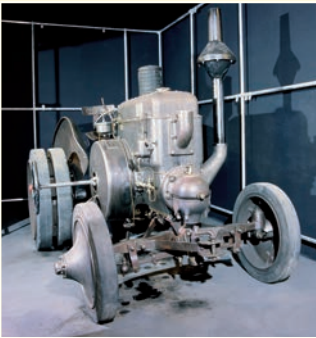
Lanz-Bulldog von 1927

Die Ausstellung „Von der Sichel zur Dreschmaschine“ stellt die Geschichte der Landwirtschaft in der Wetterau von 1800 bis 1950 dar, als rasante technische Entwicklungen weit reichende soziale Veränderungen nach sich zogen.